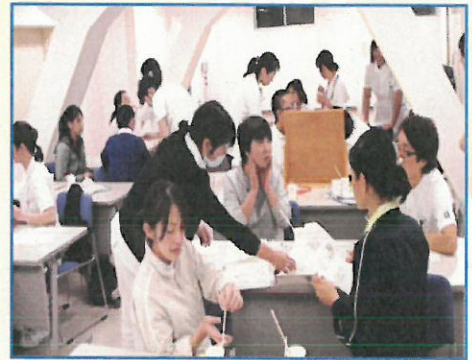
院内研修会の様子

今回の地域支援講座では、嚥下とポジショニングをテーマに開催します。講義だけではなく、少人数グループでの実習を予定しています。グループ毎に、実習担当者(リハビリ科医師・言語聴覚士等)がつく都合上、参加人数を30名と限らせて頂きます。